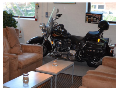
På "Bies Bryglab" kombineres selskabslokaler med udstilling af køretøjer og et bryggeri.