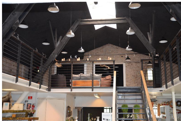
I den nye tilbygning til NotmarkHus skal der øverst være vævestue, butik mm og udstilling og selskaber nedenunder. (ill. fra Kusemølle)

Lokale borgere dyrker i fællesskab et stykke jord med grøntsager til eget brug og salg til NotmarkHus.