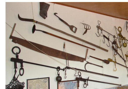
Ditlev har allerede lagt ud med at kombinere et godt måltid af råvarer fra landet og udstilling af redskaber fra landet. Denne forbindelses skal udbygges.